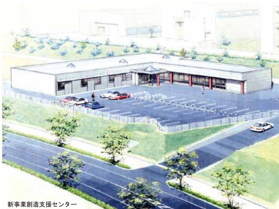
新事業創造支援センター