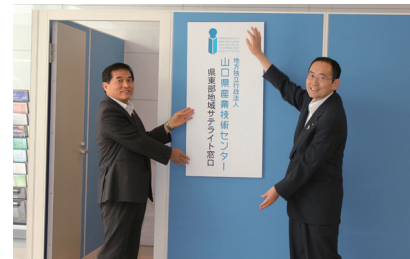
2011年7月12日に調印式とサテライト窓口の開所式を行いました。