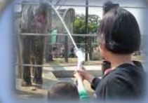
純水素型燃料電池システム 実証試験(徳山動物園)