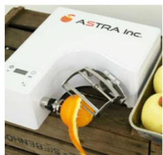
【自動皮むき機】 瞬助 KA-700H