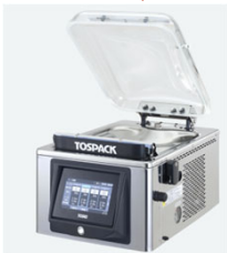
【卓上真空包装機】 クリアドームシリーズ V-393