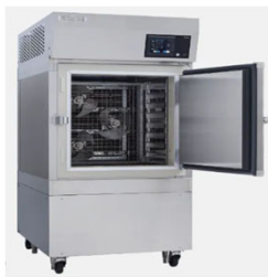
【急速冷凍機】 3Dフリーザー® KQF-8A-300B