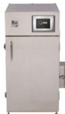
【食品乾燥機】 乾球温度・湿球温度自動制御タイプCOMPACT FOOD DRYER