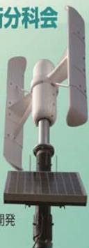
小型風車用ブレードの開発