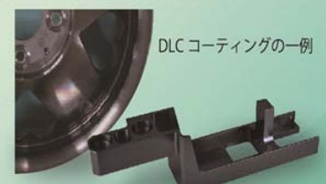
DLCコーティングの一例