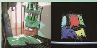
実時間3次元形状認識システム