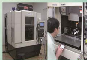
最新の加工機械を用いた実験