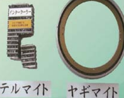
技術開発支援の事例