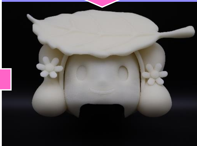
粉末焼結式樹脂造形機によるモデル作製