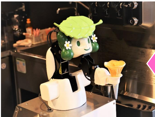
塗装仕上げ及びロボットへの取り付け