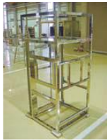
半導体製造装置筐体