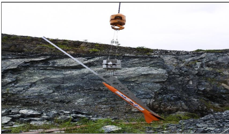
空中発射姿勢制御装置