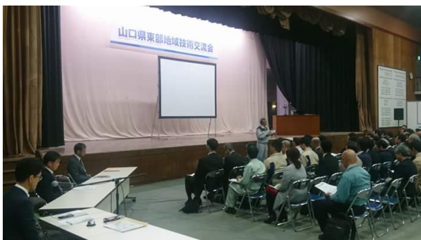
2019 東部技術交流会（プレゼンテーション参加）