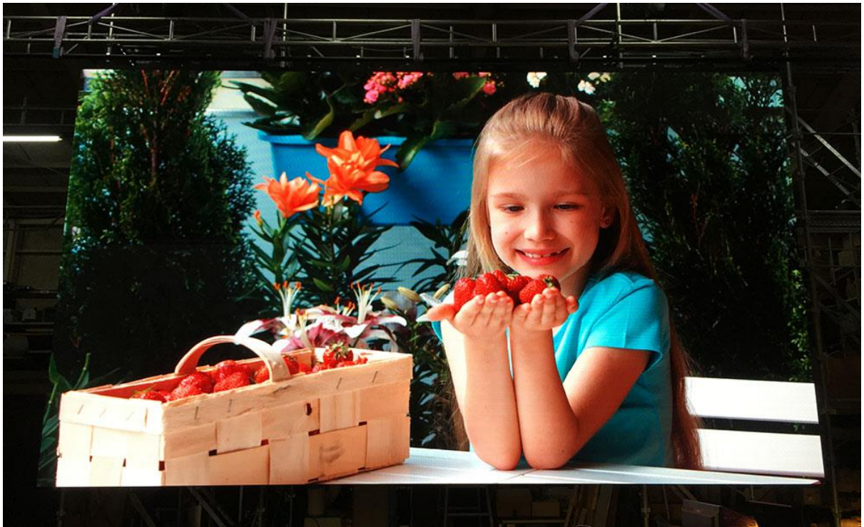
図 2. 4.6mm ピッチ LED ディスプレイ複数枚連結時の大画面