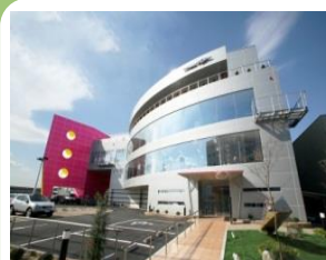
HILLTOP(株)本社 (京都府宇治市)

2002年度、2006年度「関西IT百選」最優秀企業。2008年度「京都中小企業優良企業表彰」。経済産業省「地域未来牽引企業」に選定。