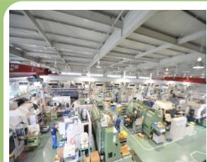
(株)ひびき精機本社工場 (山口県下関市)

第4回山口県産業技術振興奨励賞山口県知事賞受賞。第51回「グッドカンパニー大賞」受賞。経済産業省「地域未来牽引企業」に選定。