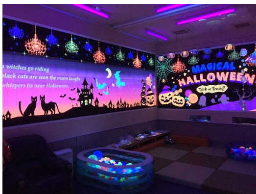
スヌーズレン体験ショールーム 「三笠館」