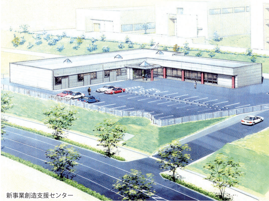
新事業創造支援センター