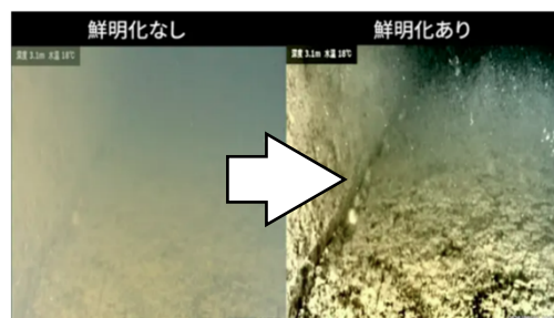
水中画像のリアルタイム鮮明化