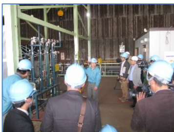
アルカリ性水溶液の電気分解による高効率水素製造システムの開発