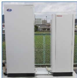
世界初となる水素ボイラー型貯湯ユニットを組み込んだ純水素型燃料電池システムの開発