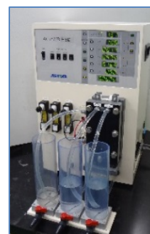
海水と淡水のみで発電する濃度差発電装置の開発