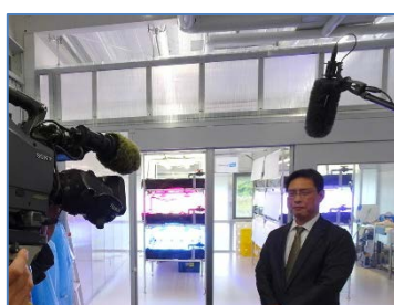
植物工場栽培用LED照明の開発