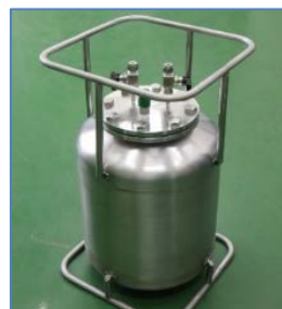
二次電池電解液向け等軽量可搬性特殊充填容器の開発